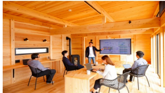
コテージはWi-Fi完備。最新ICTを導入し、経営幹部会議やチームビルディングなどの利用形態を想定