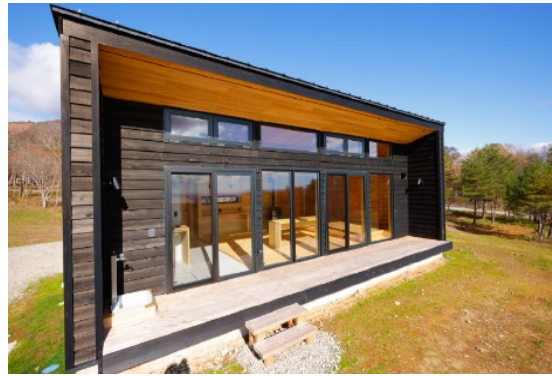
コテージの窓から仙台平野、太平洋を眺めることができます