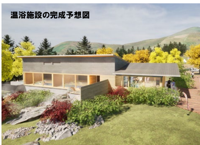
温浴施設の完成予想図

※名称募集に応募いただいた中から「最優秀賞」として1名様に賞金3万円+コテージ1泊利用券(6名定員)を、「応募賞」として、抽選で50名様に施設利用券(キャンプフリーサイト区画1泊分)を贈呈します。名称募集事務局からご連絡致します。