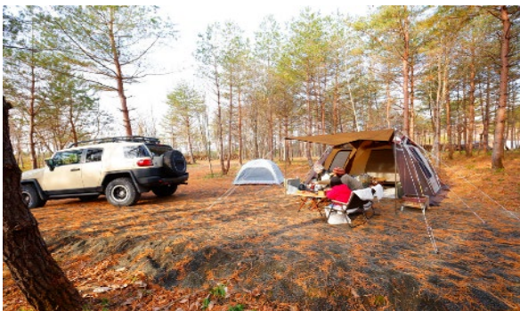
区画サイトでのオートキャンプ (2ルームシェルターも可能)