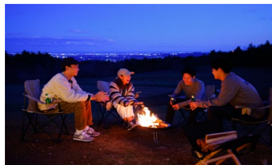
仙台市街の夜景も楽しめる