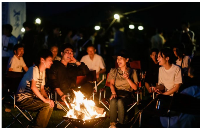
画像はイメージ