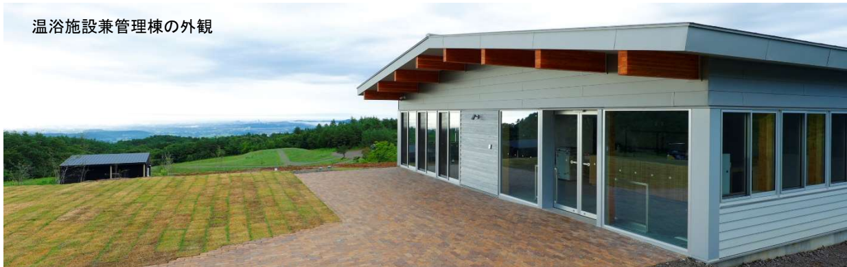
温浴施設兼管理棟の外観