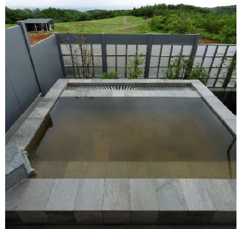
男女ともに内風呂(画像左)と露天風呂(右)を備える温浴施設。露天風呂から仙台市街を一望できる