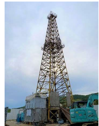
温泉掘削作業の様相 (2021年5月撮影)