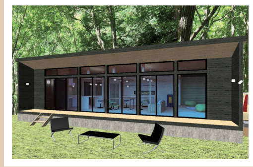
コテージイメージパース

(仮称) 泉ヶ岳キャンプ場名称公募事務局 ✉ izumigatake.koubo@gmail.com