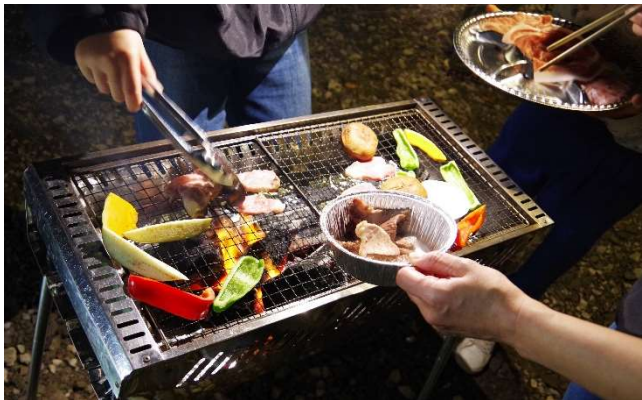
夕食はバーベキュー