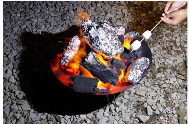
焚火で焼き芋やマシュマロ焼きに挑戦