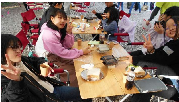
朝食のホットサンドを調理