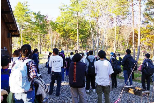
子どもと保護者・51名が参加