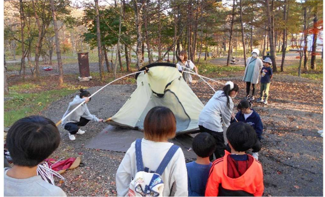
テントの設営にチャレンジ