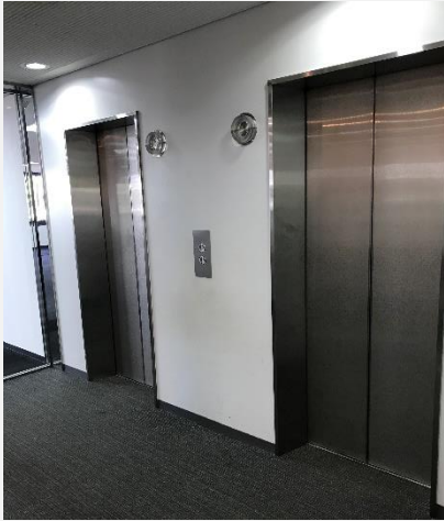
エレベーターホール