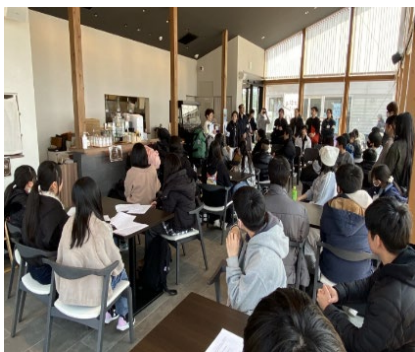
泉ピークベースに到着

夕食作りでは東北地方の郷土料理「芋煮」の調理を体験しました。BBQでは火おこしや食材の焼き方を学び、協力しながら食事を楽しみました。焚火を囲んだ交流、スカイランタン・リリース、星空観賞、天然温泉に入浴し、自然の雄大さを感じる時間となりました。