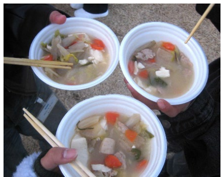
東北地域の郷土料理「芋煮」を調理