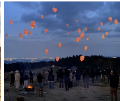
スカイランタン・リリース