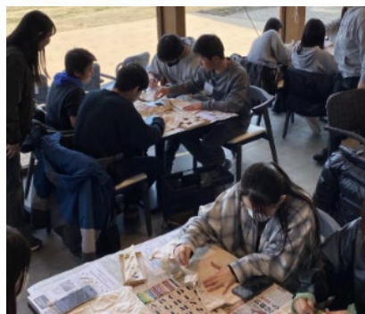
オリジナルエコバッグ作り